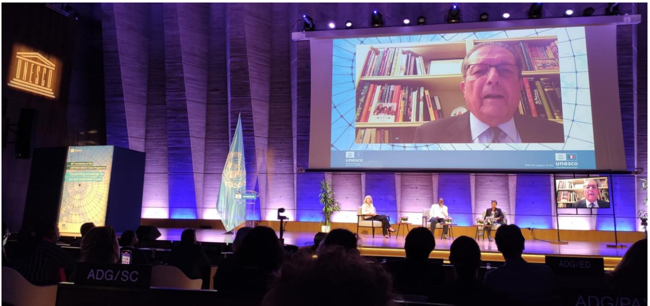
Intervención en la conferencia de París de D. Federico Mayor Zaragoza, exdirector General de la UNESCO, creador del programa Unitwin Network, primer presidente y actual presidente de honor de Fundación Triptolemos

Fundación Triptolemos participó en la celebración del 30 aniversario del Programa internacional UNITWIN/Cátedras UNESCO en su sede en París. Con motivo de esta celebración grabó este vídeo acerca de la cátedra UNESCO que comparte la UNED Science and Innovation for Sustainable Development: Global Food Production and Food Safety . Esta conferencia de aniversario celebró los logros de las últimas tres décadas y promovió diálogos interdisciplinarios auténticos y la movilización intersectorial necesaria para enfrentar desafíos complejos en el horizonte. Dedicado al tema de “Transformar el conocimiento para un futuro justo y sostenible” . El evento de dos días se basó en el espíritu de solidaridad científica, moral, intelectual y académica. El acto contó con la participación de Federico Mayor Zaragoza, exdirector General de la UNESCO y creador del programa Unitwin Network y primer presidente y actual presidente de honor de Fundación Triptolemos.