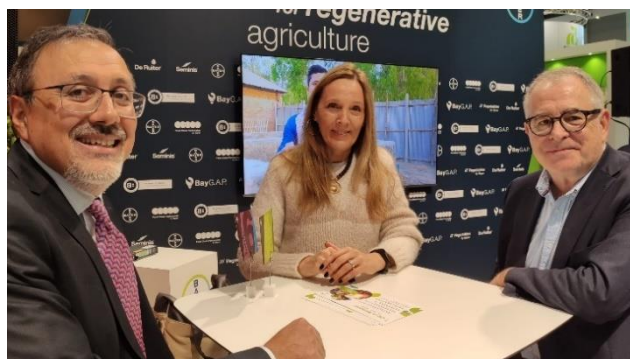
La directora de Fundación Triptolemos junto a dos miembros de la Fundación Bayer y Mercabarna reunidos en Fruit Logística 2023 (Berlín)

La Fruit Logística es una de las mayores ferias de frutas y vegetales a nivel mundial que se celebra anualmente en Berlín (Alemania). La feria contó con una gran afluencia de público y de expositores, proporcionando una visión completa de todas las novedades, productos y servicios en todo el proceso. Han estado muy presentes en esta edición temas como las soluciones para la agricultura regenerativa que buscan encontrar el equilibrio entre los resultados de productividad y la protección del medio ambiente, apoyando al mismo tiempo las necesidades de la sociedad y los agricultores, la innovación para desarrollar soluciones biológicas en áreas como la optimización del nitrógeno, el secuestro de carbono y la protección de cultivos de última generación.